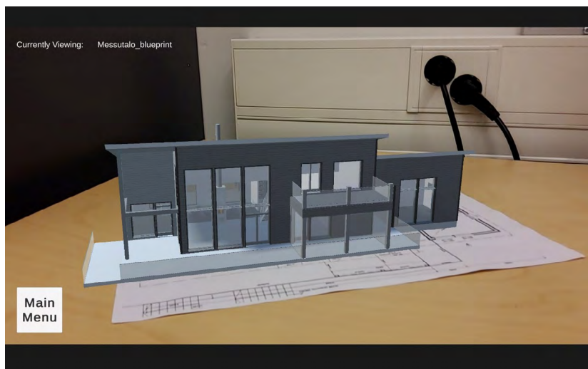
Kuva 4. Rakennuksen digitaalinen kaksonen pienoismallina pohjapiirustuksesta.

raktien konseptien havainnollistaminen ymmärrettävämmiksi (Garzón ym. 2019). AR:n avulla rakennuksen 3D-malli voidaan esimerkiksi näyttää pienoismallina rakennuksen pohjapiirustuksen päällä. Näin rakennussuunnitelmat pystytään havainnollistamaan ennen rakennustöiden aloittamista myös maallikolle, jolla ei ole taitoa lukea monimutkaisia piirustuksia, eli esimerkiksi asiakkaalle tai tulevalle käyttäjälle. (Kuva 4.)