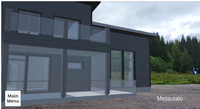
Kuva 5. Rakennuksen digitaalinen kaksonen oikean kokoisena osana ympäristöä.

Lisätyn todellisuuden hyödyntämisellä koulutuskäytössä on tutkitusti positiivinen vaikutus opitun asian määrään ja opiskelumotivaatioon. AR:n käyttöä teollisuudessa on tutkittu tähän mennessä suhteellisen vähän. (Garzón ym. 2019.) Rakennusalalla työntekijät voisivat saada perehdytyksensä rakennettavaan kohteeseen tai työtehtäviinsä AR-sovelluksella, jossa esimerkiksi työvaiheita tai jonkin laitteiston käyttöä ohjeistetaan 3D-mallien ja animaatioiden avulla. Lisäksi AR-sovelluksella voidaan näyttää muutakin tietoa ympäristöstä, kuten turvalliset ja vaaralliset alueet tai laitteistoihin liittyvät reaaliaikaiset tiedot.