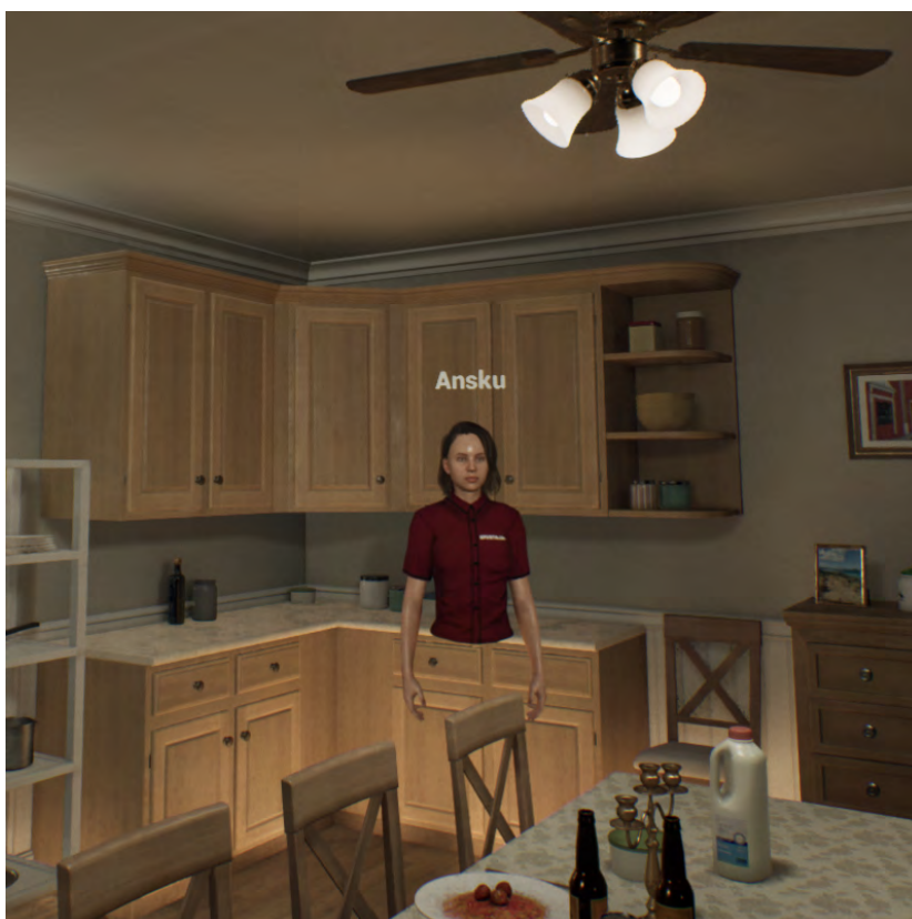
Kuva 1. Virtuaalinen taloesittely meneillään.

Yhteissuunnittelu 3D-ympäristössä mahdollistaa uudenlaisia suunnittelu- ja yhteistyömenetelmiä niin työntekijöiden kuin myös asiakkaiden välillä. Kaikki Virrakkeessa tehdyt toiminnot näkyvät muille käyttäjille. Tämä tarkoittaa, että huoneita voidaan esimerkiksi sisustaa yhdessä. Kohteessa voidaan myös tehdä erilaisia mittauksia tai vaikkapa piirroksia, tai niihin voidaan jättää viestejä muiden käyttäjien nähtäviksi.