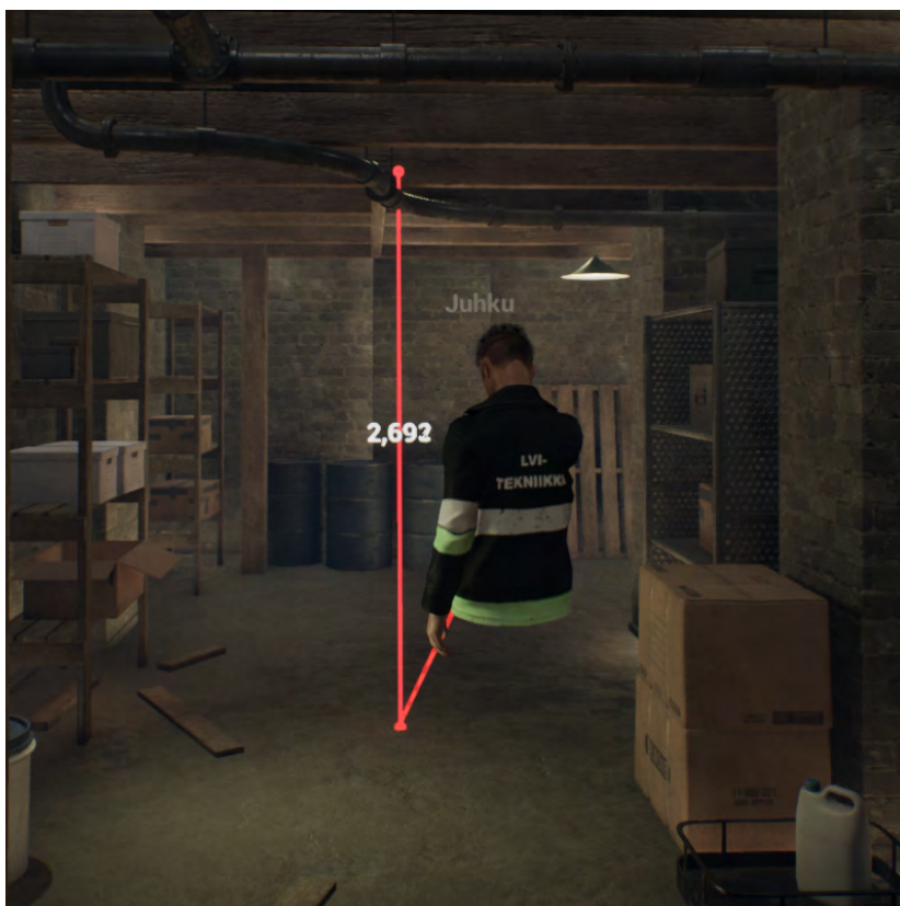
Kuva 2. Mittaustoimenpide kellaritiloissa.

Käytännön esimerkki Virrakkeen hyödyntämisestä joukkoistamisessa voisi olla esimerkiksi seuraavanlainen: Kaupunki on rakentamassa uutta puistoaluetta. Suunnittelusta vastaava henkilö miettii, mikä olisi paras puiston pohja-asetelma. Kaupungin hallinto on saanut useita tarjouksia sekä esimerkkejä siitä, miltä puisto voisi näyttää. Kaupunginjohtaja päättää, että annetaan päätösvalta puiston tuleville käyttäjille eli tavantallaajille. Puiston tyhjä malli tuodaan Virrakkeeseen virtuaalipuistona, ja alustan äänestystyökaluja käyttämällä virtuaalimaailmaan voidaan luoda äänestysvaihtoehdot puiston eri pohja-asetelmista.