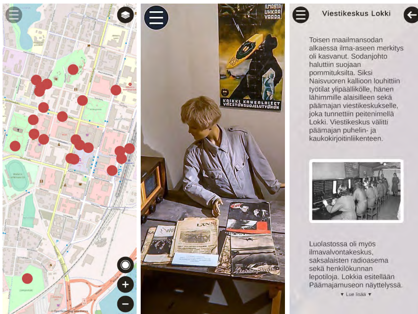
Kuva 1. Päämajakaupunki Mikkeli -sovelluksen paikkapisteitä kartalla sekä yhden paikkapisteen 360°-sisäkuva ja tietosivu.