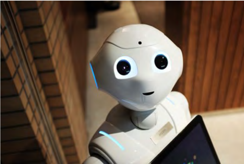
Kuva 1. Robotti digitaalisella alueella.

Digitaalisuuden hyödyntäminen tehostaa liiketoimintaa. Sähköiset työkalut ja pilvipalvelut vähentävät aikaa ja resursseja vaativien rutiinitehtävien määrää. Automaatio auttaa optimoimaan prosesseja ja varmistamaan virheettömän suorituksen. Työntekijöille vapautuu aikaa keskittyä luovuutta ja korkeampaa lisäarvoa tuottaviin tehtäviin.