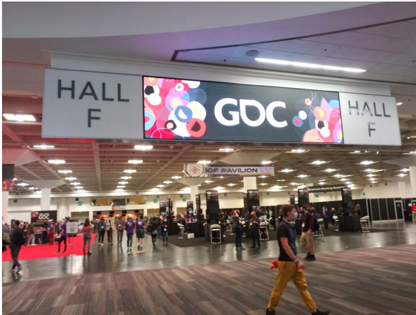
Kuva 3. GDC (Game Development Conference) San Franciscossa 2022.

Pandemian aikana vuonna 2020 pelialan suosio kasvoi merkittävästi nuorten keskuudessa. Maailman talousfoorumin (Read 2022) mukaan pelialan arvo voi kasvaa vuoteen 2026 mennessä jopa 321 miljardiin Yhdysvaltain dollariin. Uusia teknologioita nousee jatkuvasti, ja ne tuovat mukanaan uusia markkinamahdollisuuksia. Esimerkiksi virtuaalitodellisuus- eli VR-pelien markkinat kasvavat jatkuvasti. Markkinoiden arvioitu kasvu vuonna 2021 oli 7,92 miljardia Yhdysvaltain dollaria ja arvo nousee vuoteen 2028 mennessä 53,44 miljardiin, jolloin yhdistetty vuotuinen kasvuvauhti on arviolta 31,4 prosenttia vuosina 2021–2028 (Davies 2023).