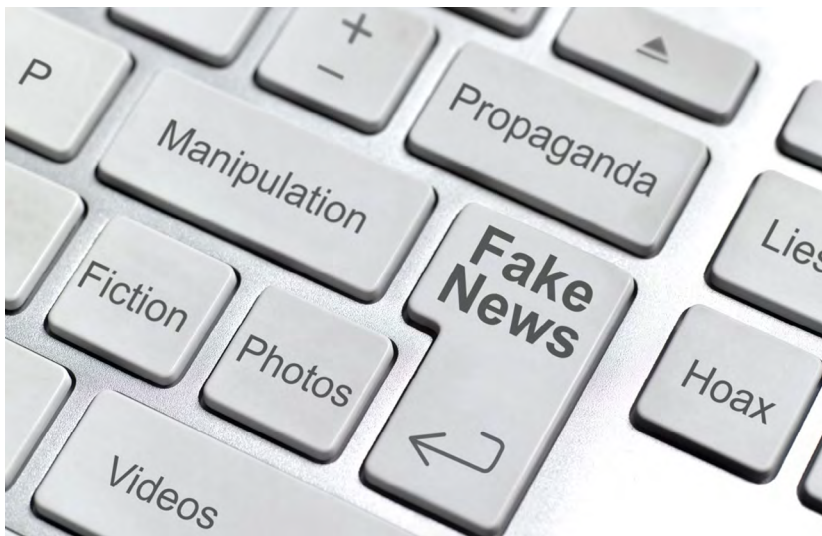
Kuva 4. Valeuutisia. (kuva: Getty image – Fake News)

Ei niin hyvää, ettei jotain pahaakin. Digitaalisessa maailmassa uhat kasvavat samaan tahtiin uusien liiketoimintamahdollisuuksien kanssa. Esimerkiksi tekoäly hoitaa monet toimistorutiinit automaattisesti, luo uutta sisältöä ja tarjoaa vielä kartoittamattomia mahdollisuuksia teknisen suunnittelun ja terveydenhuollon kaltaisilla aloilla.