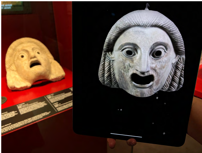
Kuva 1. Vitriinissä oleva alkuperäinen naamio ja tabletin ruudulla oleva filteri rinnakkain.

lisäarvoa ne toivat asiakaskokemukseen ja mitä mahdollisuuksia ne antavat näyttelyiden kehittämiseen. Teokset toteuttivat Kokemusten talo-hankkeessa TKI-asiantuntijoina toimineet taiteilijat.