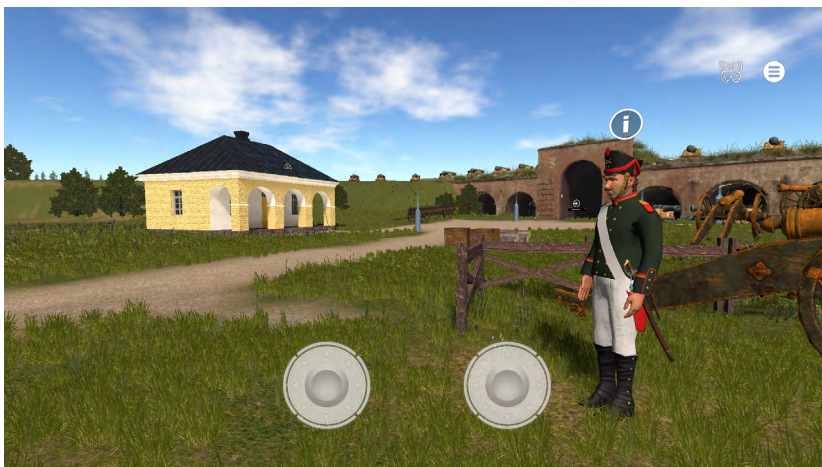
Kuva 6. Virtuaalisessa Kyminlinnassa tykistökersantti opastaa kanuunahaupitsin lataamisessa ja laukaisemisessa. (Kuva: kuvakaappaus virtuaaliympäristön kehitysversiosta)