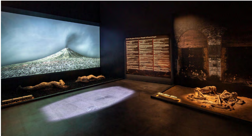
Kuva 2. Näkymä näyttelystä. Jäljet tuhkassa -teos sijoittui tilaan, jossa oli valoksia purkauksen uhreista sekä purkauksen vaiheita havainnollistava animaatio.

Jäljet tuhkassa -teos koettiin tunnelmallisena ja sopivan hyvin yhteen tulivuorenpurkauksen vaiheita esittävän animaation kanssa. Kävijät saivat vaikutelman, että seinälle projisoidun animaation leijaileva tuhka jatkoi matkaansa lattialle heijastettuun teokseen. 60 prosenttia vastaajista arvioi teoksen hyvin tai erittäin kiinnostavaksi, 40 prosenttia hyvin tai erittäin yllättäväksi. Suurin osa (69 %) vastaajista arveli, että teos auttoi samaistumaan purkautumisen hetkeen, mutta teoksen ei koettu olevan kuitenkaan surullinen. (Kuva 2.)