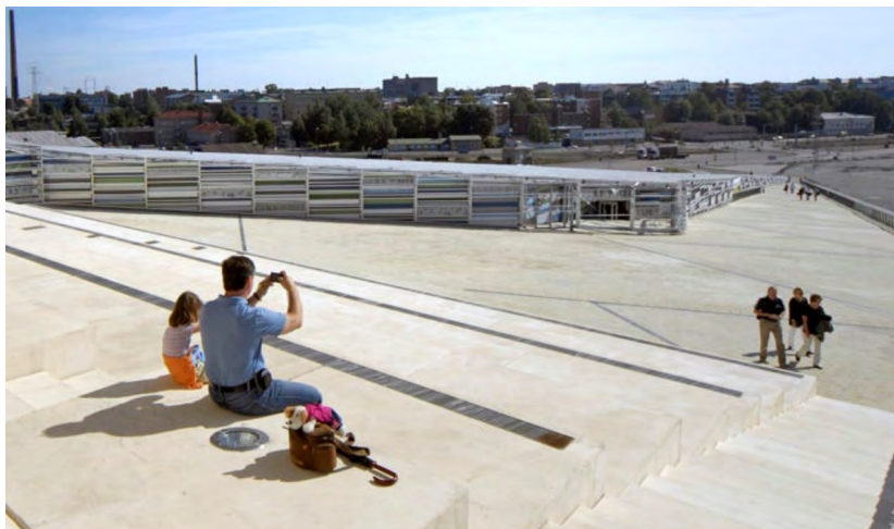
Kuva 3. Näkymä Merikeskus Vellamon katolta.

Miltä näytti Kotkan satama 1900-luvun alussa? Pilotissa käytetään AR-tekniikkaa, jonka avulla Vellamon katolla seisova asiakas voi mobiililaitteellaan nähdä, miltä Kotkan satama näytti noin 100 vuotta sitten. (Kuva 3.)