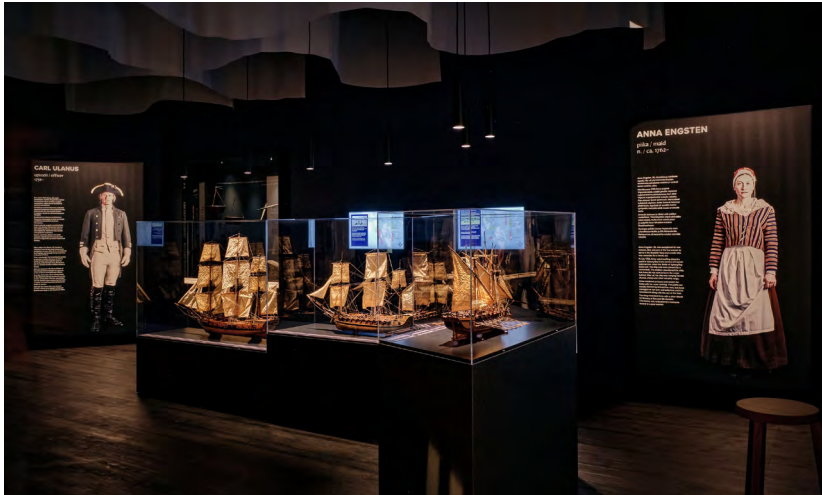
Kuva 4. Laivan pienoismalli.

Opinnäytetyönä konseptoidaan AR-mobiiliteknologian hyödyntämistä staattisten museoesineiden elävöittämiseksi. Museon pienoismalleihin lisätään hahmoja ja muita elementtejä rikastamaan asiakaskokemusta. (Kuva 4.)