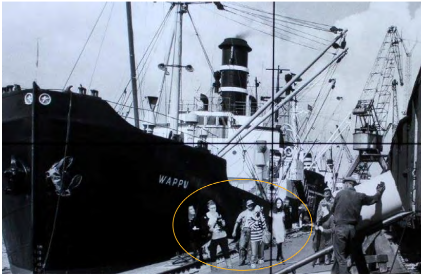
Kuva 5. Kymenlaakson museon kävijät osana Ihmeseinää.